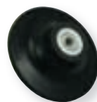
502997 - 2" Tampon 502998 - 3" Tampon (standard)

Accessoires standards : Tampon de 3" x 1/4"-20UNC - 1 (502998) Tampon de 2" x 1/4"-20UNC - 1 (502997)