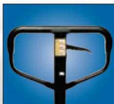
Levier de commande à trois positions assurant la commodité d'utilisation