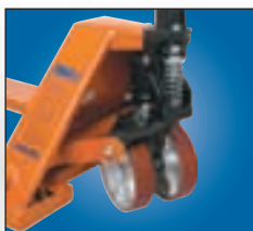
Groupe hydraulique hermétique. Roulettes en acier revêtues de polyuréthane