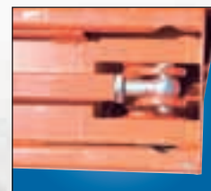
Barre de liaison entièrement réglables