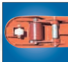
Roulette avant simple ultrarobuste avec galet d'extrémité de fourche facilitant l'entrée et la sortie de la charge de l'appareil